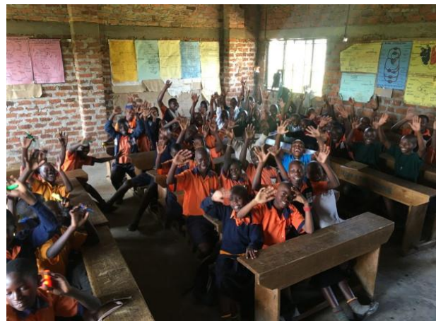
Die Glory Christian School – die erste von Celebrate Hope Ministries gegründete Schule: Zugang haben alle Kinder