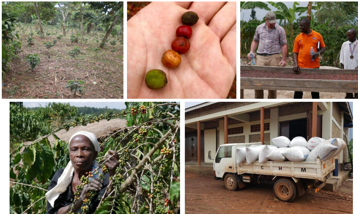
Unterstütze Farmfamilien für den Kaffeeanbau

Der Ankauf der geernteten Kaffeebohnen, das Rösten, Verpacken und der Verkauf wird durch Celebrate Hope Ministries (CHM) organisiert.